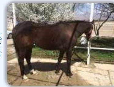
پیش از مصرف

Bio-Equine® از طریق مقابله با باکتری های مولد آسیب های پوستی، بهبود هضم و جذب پروتئین و مواد معدنی، تولید ویتامین ها و آنتی اکسیدان ها موجب افزایش زیبایی و درخشش پوست می شود. Bio-Equine® با سم زدایی از خون و کمک به گردش خون سالم در ریشه موها، موجب افزایش رشد و سلامت موها می شود.