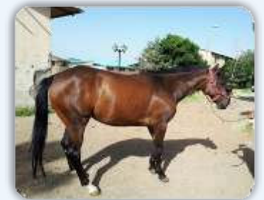
۴۰ روز بعد از مصرف

مصرف Bio-Equine® در اسب، از طریق افزایش ایمونوگلوبولین های ترشحی و تولید سیتو کینین ها، سبب تحریک سیستم ایمنی شد. میزان مصرف Bio-Equine® به ازای هر اسب بالغ، ۱۵ گرم بود.